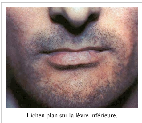
Lichen plan sur la lèvre inférieure.

L'aspect du lichen plan est varié [17] et diffère selon sa localisation sur le corps.